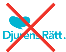
Logotypen har modifierats