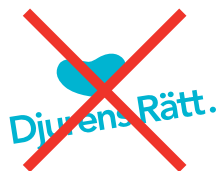
Logotypen är vinklad

Djurens Rätts logotyp består av en symbol och en ordbild och får inte modifieras. Dock finns möjligheten att i vissa lägen lyfta ut symbolen från själva logotypen för användning separat.