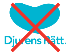
Logotypen har modifierats