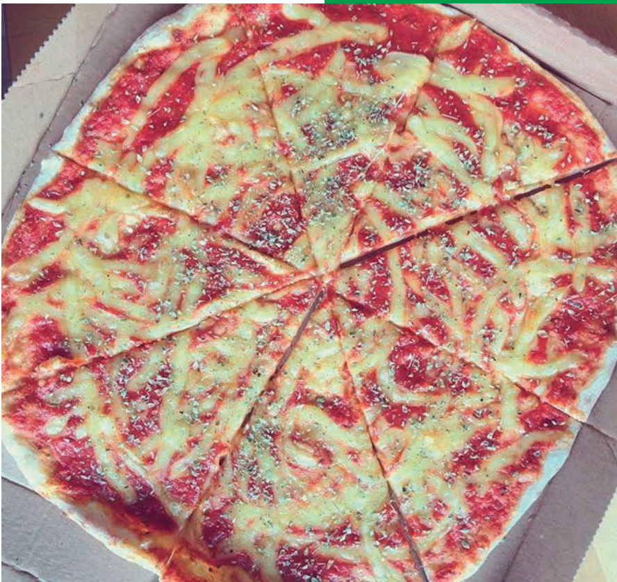
Margeritha från Pizzakungen.

Prisklass: Medel / Öppettider: Sön-Tis 16:00-21:00, Ons-Lör 12:00-21:00 / Adress: Stålgatan 44B