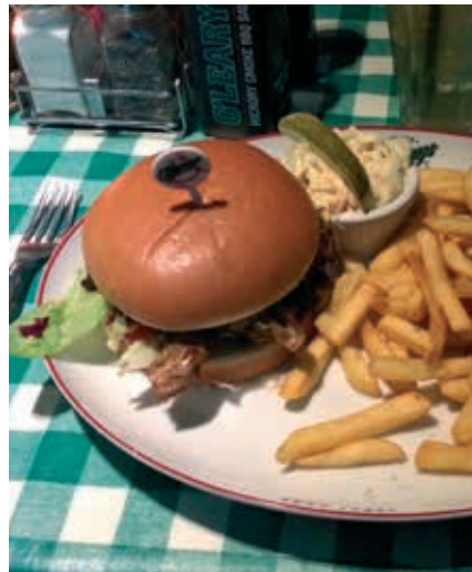
Oumph-burgare på O'learys.

Sportbar och restaurang. Flera veganska rätter att välja på som till exempel fajitas, nachos och burgare med Oumph. Står tydligt vilka rätter som är veganska.