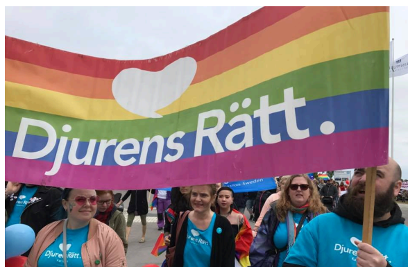
Prideparaden i Karlskrona

På Lövmarkanden 22 juni hade vi ett informationstält tillsammans med sommarturnén. Många nya medlemmar värvades och ett stort antal namnunderskrifter för Europas grisar under kampanjen End Pig Pain samlades in.