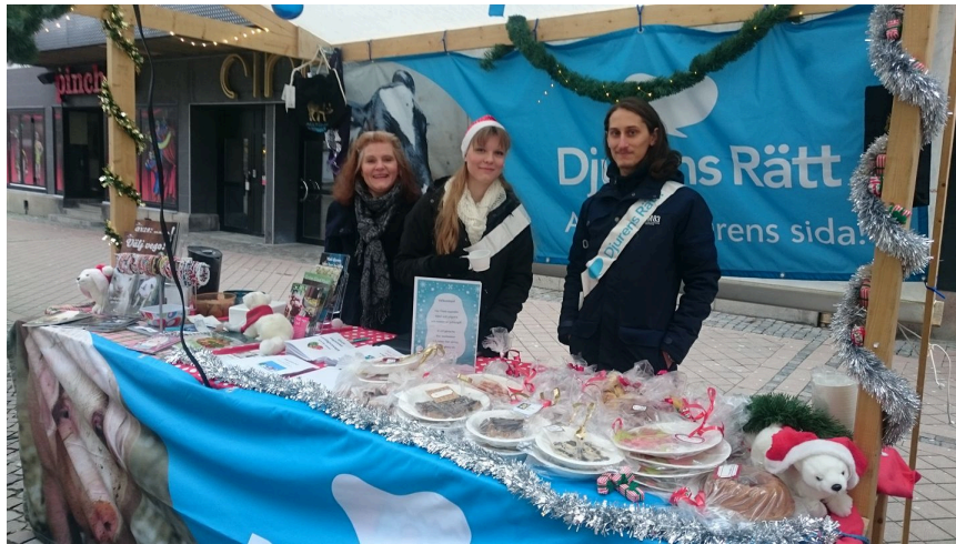
Adventsmarknad på stan

Den 17 december hade vi ett bord vid Karlskrona Citys adventsmarknad och sålde veganska bakverk och delade ut veganska recept.