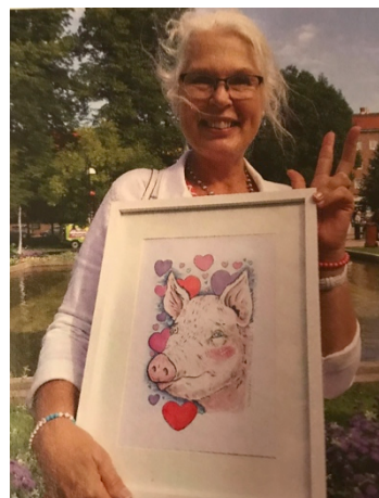
Vinnare av den fina djurrättstavlan under Live Green