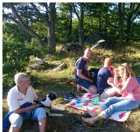
Vegogrillkväll. Besökarna bidrog med trevlig musik!