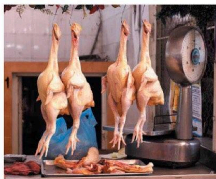
Kycklingar är individer. Kycklingkött till salu på en marknad i Mazatlan, Sinaloa, Mexico.

Men vad ska jag då lägga på grälen i sommar? Varför inte prova marinerade tofua och grönsakspest, cevapcici på rostbar vegofärs, eller en härlig vegoburgare? Idag finns så mycket att äta som inte orsakar lidande. Kycklingar är de djur som är allra flest och förmodligen också de som har det allra sämst. Genom att välja bort dem från tallriken kan du göra stor skillnad! ■